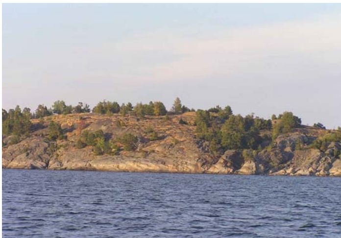
Die ersten Schären ...

Ein 'Mitreiter' verlässt mit Sonnenaufgang gegen 04:00 morgens kurz nach mir Visby. Zunächst geht es vorbei an einer Megayacht, die wohl im Hafen keinen Platz