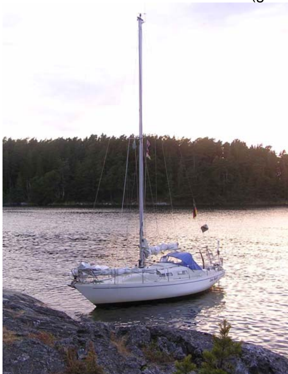
Naturhafen bei Runmarö

Abends suche ich mir ein nettes Plätzchen, nehme dabei bei tastender Maschinenfahrt einen Felsen mit (geht ja nicht ohne) und gehe schließlich in den Naturhafen unmittelbar südlich Runmarö mit dem Bug an den Fels. Bei herrlichem Sonnenuntergang gönne ich mir einen Single Malt und die erste Schärenzigarette.