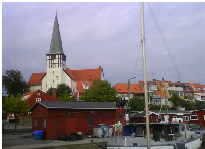
Rønne / Bornholm

Bei moderaten südlichen Winden geht es dann über Christiansö nach Rønne. Mittlerweile macht die Wellendichtung am Stevenrohr etwa einen Liter Wasser am Tag, wenn auch unter Maschine gefahren wird – wieder etwas für die Arbeitsliste.