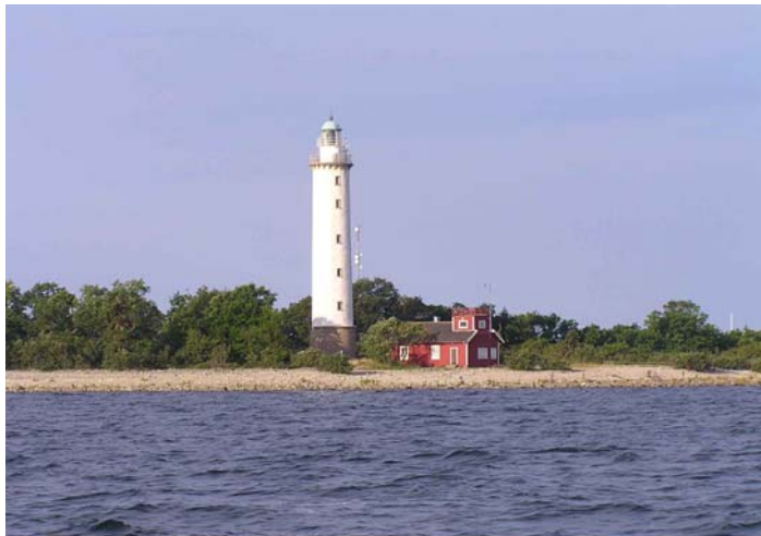
Ölands Nörra Udde

die letzten Waldreste vom Deck – Abschied von den Schären! Mit Hilfe des Leuchtturmes 'Kungsgrundet', an dem ich mit Ostkurs südlich vorbeiziehe, mache ich von 11:20 bis 12:20 eine Doppelpeilung mit Versegelung; die Position liegt gut zwei Kabellängen südwestlich der GPS-Position – geht doch! Abends laufe ich in die schöne Bucht Grankullaviken an der Nordspitze von Öland ein. Der dortige Gästhavn wird aber gerade nicht betrieben, und so bleibt nur eine klobige Betonpier.