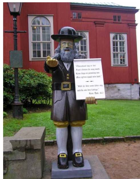
Rosenbom-Figur in Karlskrona

Im Kalmarsund herrscht am nächsten Vormittag nur warmer, lauer Daddelwind. Erst bei Borgholm kommt ein stetigerer O 3 – das ist wohl königlicher Wind! Aus dem Königswind wird schließlich Kaiserwetter, und bei Sonne und 6,5 kn ohne jede Welle geht es bis Kalmar. Der Hafen ist sehr schön und voller Deutscher – hier stecken die alle! Dann ist schon wieder Schluss mit dem guten Wetter, und morgens läuft kaum einer aus. Aber graue Wolken hin oder her – einen NNO 5 darf man meines Erachtens nicht liegen lassen, wenn man hier im August nach Süden will. Ich mache gut Meilen, und bei Sandhamn / Torhamn gehe ich in die Schärenabkürzung nach Karlskrona. Im dortigen Handelshafen liegen Myriaden von riesigen Rohrsegmenten – das kann nur die Ostseepipeline sein! In Karlskrona liegen neben