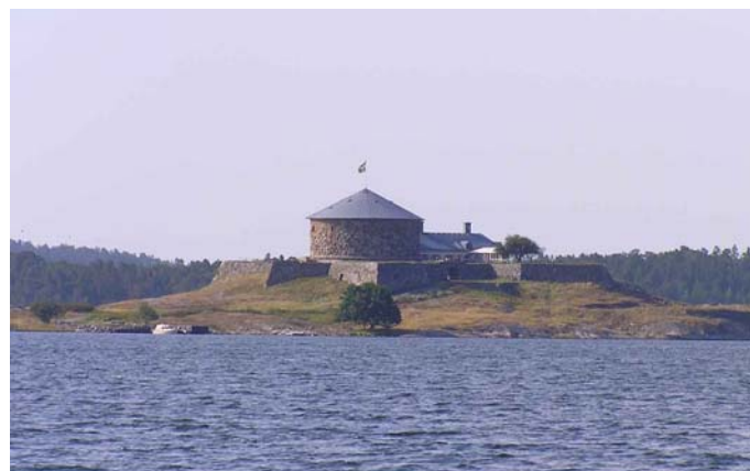
Kastell bei Dalarö

Am nächsten Tag motore ich gegen SSW 5-6, und auch wenn die Wellen wegen der Wassertiefe nicht so hackig wie im Bodden oder im Watt sind, ist das nichts für meinen kleinen Faltpropeller. Ich laufe nach Dalarö, wo unheimlicher Trubel herrscht mit allem, was man auf, über und unter Wasser bewegen kann. Danach geht es wieder an die Hauptroute nach Südwesten, wobei eine Insel auffällt: