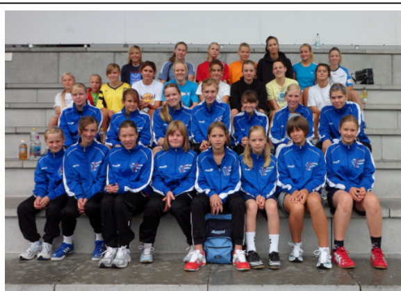
Durch harte Trainingsarbeit wollen die Mädchen der Jugend A, C und D ihre leistungssportlichen Ziele verwirklichen, die in die Aufnahme bei den Rostock Dolphins münden sollen.